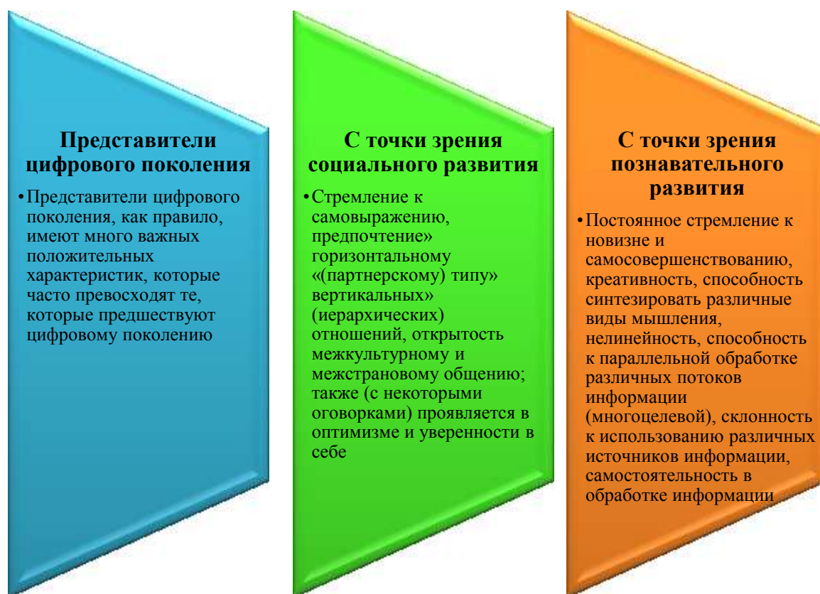
Рисунок 2 - Особенности представителей цифрового поколения

Образовательный процесс в цифровой образовательной среде имеет преимущества по сравнению с традиционным обучающим процессом: